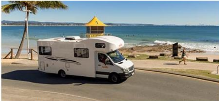
Aussenansicht Apollo Motorhome Holidays Euro Deluxe