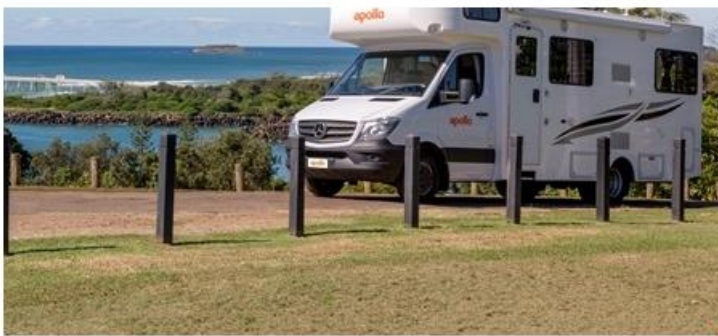
Aussenansicht Apollo Motorhome Holidays Euro Camper