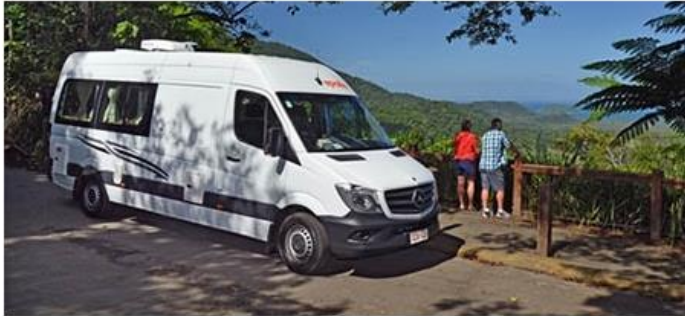
Aussenansicht Apollo Motorhome Holidays Euro Tourer